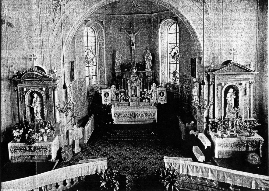
BIS 1936 HATTEN DIE BRETTENER KATHOLIKEN ihr Gotteshaus im Ostteil der Stiftskirche, dort, wo heute das evangelische Gemeindehaus ist. Nach dem Verkauf wurden die Altäre abgebaut, die darin aufbewahrten Reliquien ins Pfarrarchiv gebracht. Nun haben sie ihren Platz in der ehemaligen Taufkapelle von St. Laurentius gefunden.

Im Jahre 1787 wird die neu erbaute katholische Kirche geweiht. Sie dient dann der Pfarrei St. Laurentius bis zum Verkauf 1936 als Stadtkirche. Die 1787 eingeweihte spätbarocke Kirche ist wesentlich größer als der kleine gotische Chor der alten Kirche. Die Katholiken haben damit für 150 Jahre ein schönes Gotteshaus, das innen mit barocken Altären ausgestattet ist. Eine Fotografie aus der Zeit vor 1936 zeigt den alten Zustand der katholischen Kirche im Inneren. Der Zugang zur